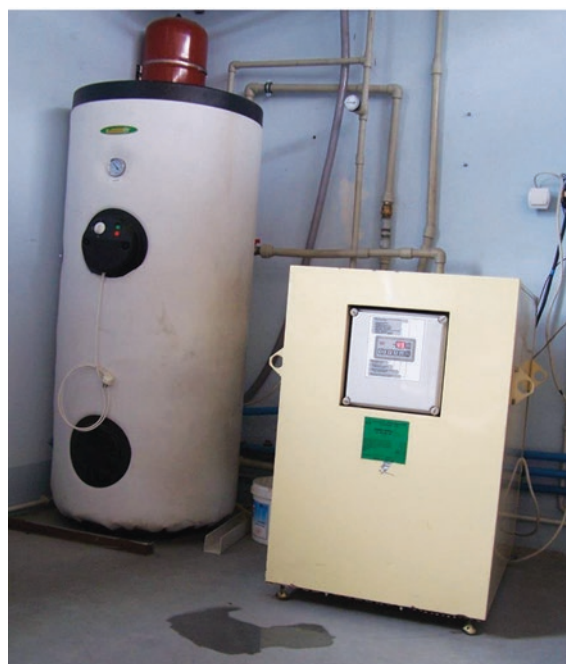
Rys. 2. Instalacja pompy ciepła do odzysku ciepła z produkcji w zakładzie przemysłowym